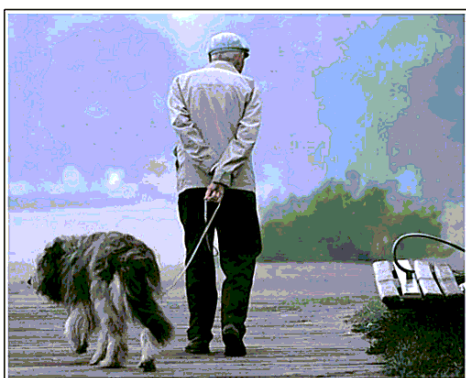
Un anziano a passeggio con il suo cane

zione anziano-pet esercita sulla spesa pubblica in termini di risparmio per il Servizio sanitario nazionale. Per queste ragioni Senior Italia Federanziani e Anmvi, l'associazione dei medici veterinari italiani, si uniscono nella richiesta di riduzione della pressione fiscale che grava sul possesso di un cane o di un gatto. «In Italia c'è un'aliquota Iva da record storico sulle cure veterinarie e sul mantenimento dei pet e detrazioni fiscali non adeguate al costo della vita e delle pensioni», dicono.