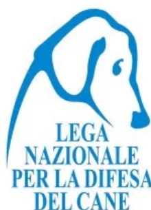
Logo Lega Nazionale per la Difesa del Cane

Proprio per questo Federanziani e ANMVI continuano a chiedere la riduzione della pressione fiscale che grava sul possesso di un cane o di un gatto, e la promozione delle adozioni pet.