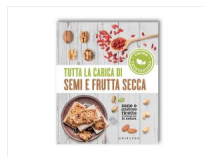
Tutta La Carica Di Semi E Frutta Secca