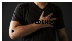
Patologie cardiovascolari, tra prevenzione e fattori di rischio