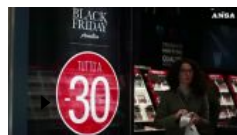
Black Friday, come fare acquisti al riparo da hacker