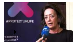
Brandi (Firmo): Prevenzione ha ruolo chiave per cura osteoporosi