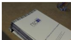
NSA presenta il primo indice globale sullo stato delle pmi