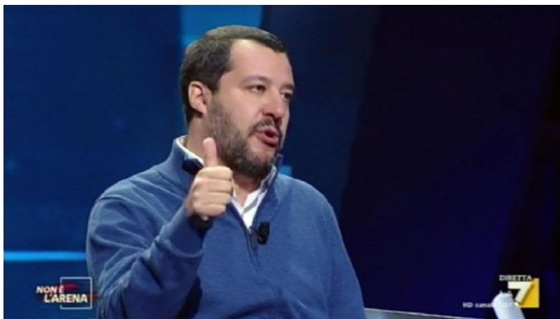
Il vicepremier e ministro dell'Interno Matteo Salvini ospite a Non è l'arena

ROMA - Le cifre della manovra che girano in questi giorni sono come "i numeri del lotto». Lo ha detto Matteo Salvini a 'Non è l'arena'. "Stiamo leggendo i numeri del lotto in queste settimane. Molto semplicemente voglio cominciare a mantenere gli impegni presi con gli italiani anche sulle tasse e sull'economia, come in questi sei mesi sull'immigrazione, sulla sicurezza" ha spiegato il vicepremier. "E' chiaro - ha precisato - che non si può fare tutto e subito». Ma il punto non è la discussione sui decimali del rapporto deficit-Pil: "Chi mi ferma a Roma e Milano non mi dice 'mi raccomando Salvini, il 2,4% di deficit'. Mi dice: 'MI raccomando Salvini, mio figlio non lavora da tre anni, fate in modo che possa provare a trovare un lavoro'".