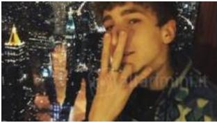
Ragazzino scomparso, Rimini in ansia. Da giovedì ancora nessuna traccia di...