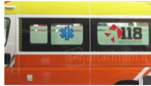
Schianto a Rivabella: una donna rimane incastrata, la liberano i vigili del fuoco