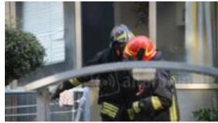
Prende fuoco la camera da letto: devono intervenire i vigili del fuoco di Novafeltria