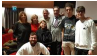
Ragazzino ucciso da autista ubriaco, mamma vittima incontra studenti di Rimini:...